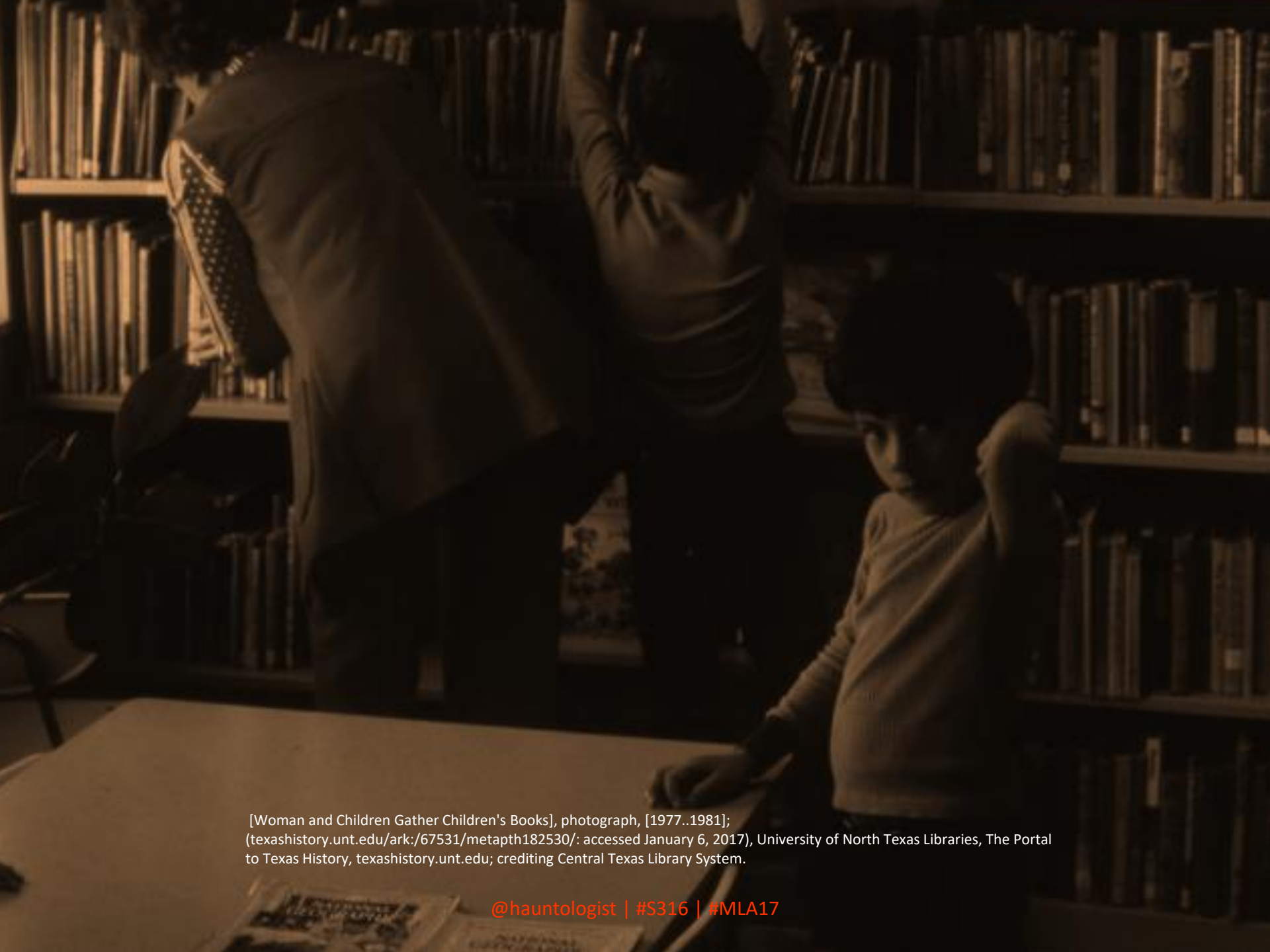
[Woman and Children Gather Children's Books], photograph, [1977..1981]; ( texashistory.unt.edu/ark:/67531/metaph182530/ ; accessed January 6, 2017)