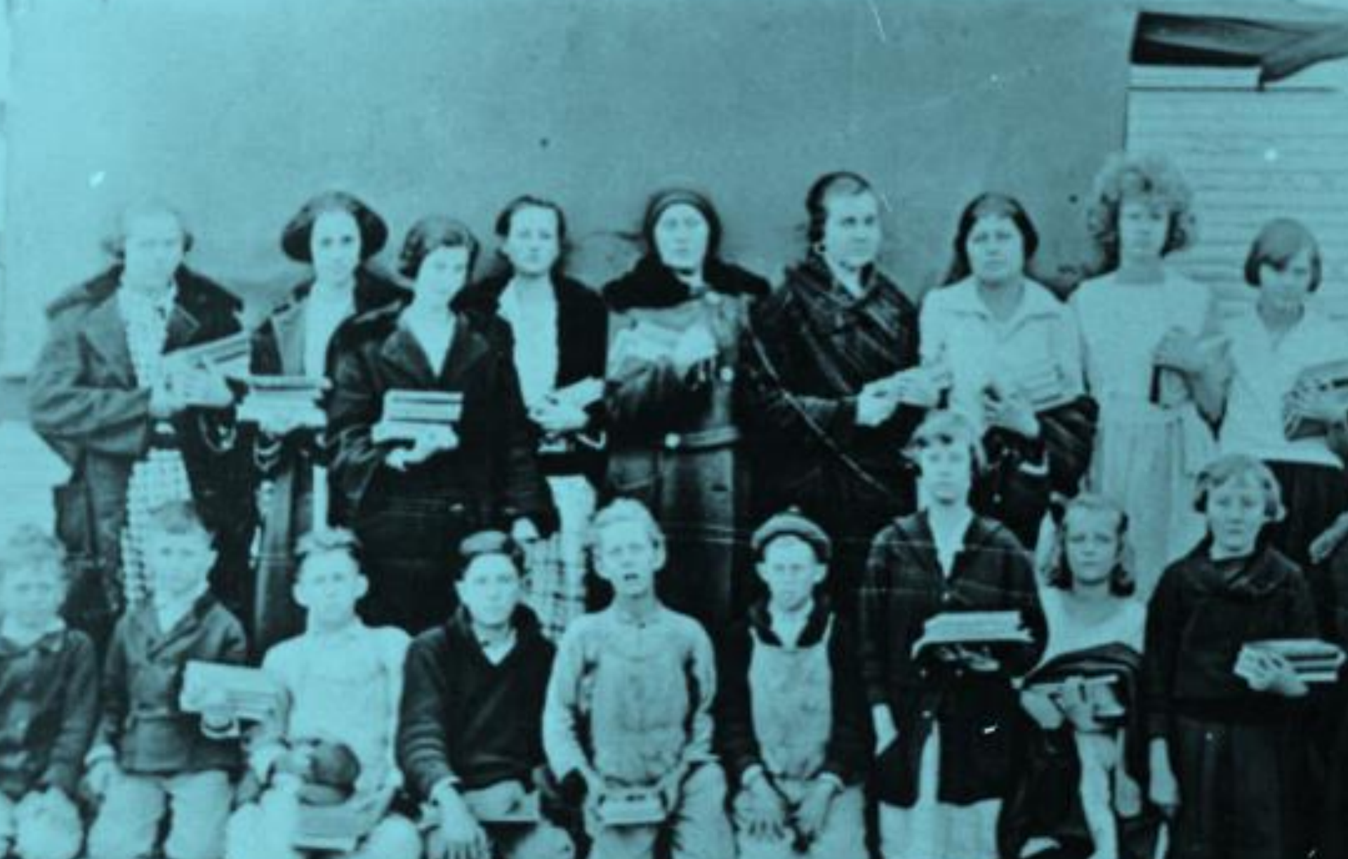
Cherokee County Historical Society. [Children Carrying Books], photograph, [1980..1990]; (texashistory.unt.edu/ark:/67531/metaph354373/: accessed January 6, 2017), University of North Texas Libraries, The Portal to Texas History, texashistory.unt.edu; crediting Cherokee County Historical Commission.