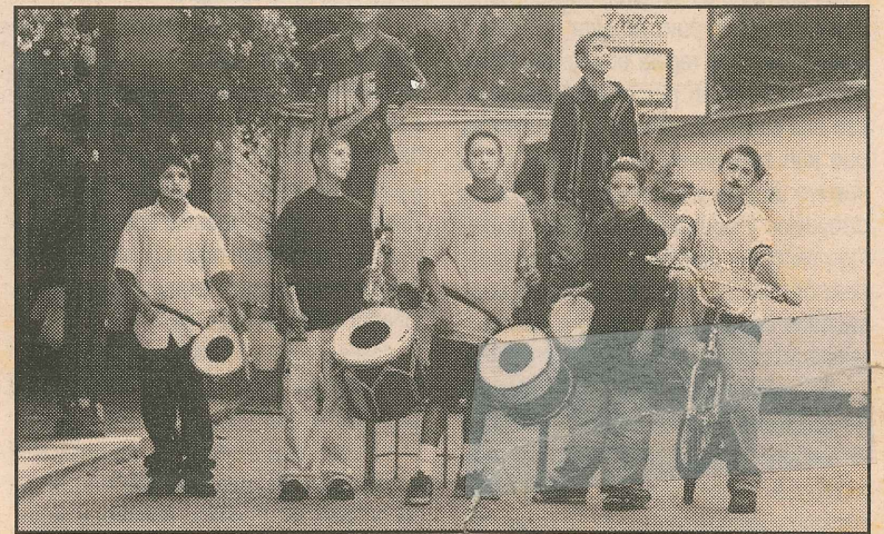
Chirimia del Comité Cultural de Altavista.

Así las cosas, la junta directiva del plan zonal tiene unidad de criterios para trabajar porque este proceso vaya encontrando soluciones a dificultades primarias como desempleo, educación, y los efectos de estas dos, la violencia intrafamiliar, la salud y la desnutrición