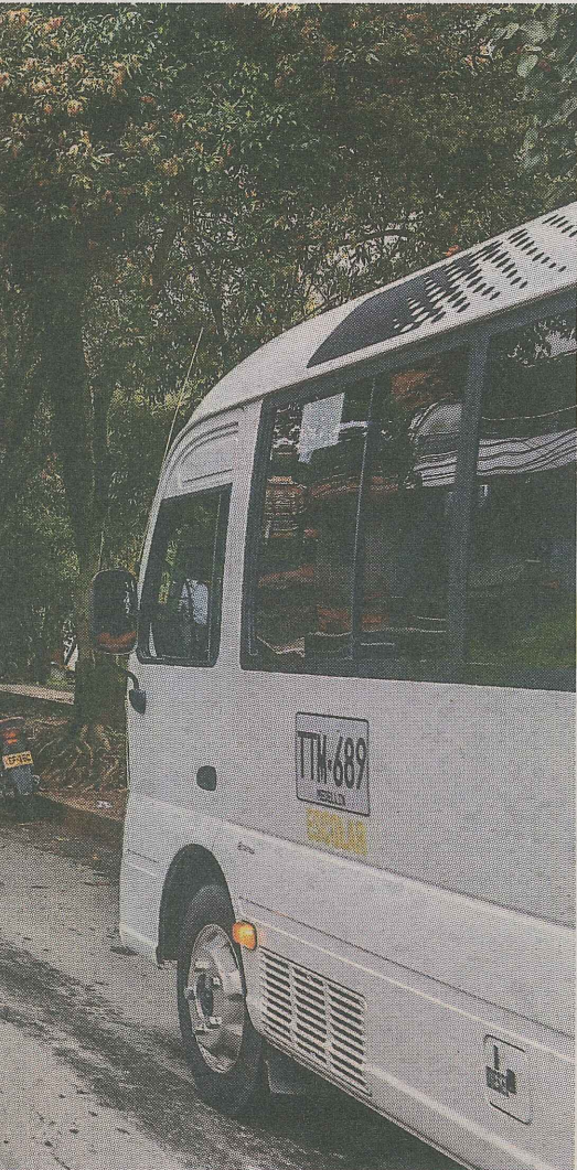
El proyecto vial impacta a 74.000 familias de las comunas de Belén y Guayabal.